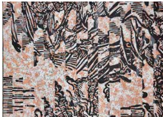
Philippe Guesdon, Apocalypse 25-1 , (détail) Acrylique et poudre de métal sur toile, 2014. Courtesy de l'artiste.

Inscriptions aux ateliers / workshops avec l'artiste. Renseignements au 02 37 38 87 51 Entrée libre dans la limite des places disponibles Inscription sur : visites@ville-dreux.fr