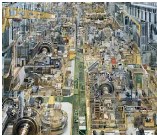
Stéphane Couturier, Usine Alstom (détail), Halle Power, 2009

Exposition en partenariat avec le conseil département d'Eure-et-Loir